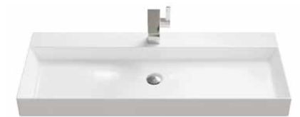
Keramik 61 | 81 | 101 | 121 cm.